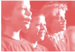
Singen macht Spaß

Musikalische Früherziehung ist ein attraktives und bewährtes vor-