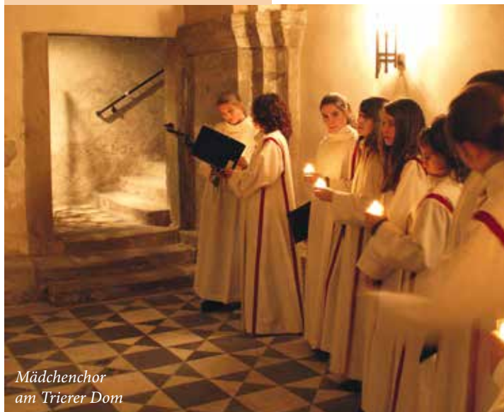
Mädchenchor am Trierer Dom

Samstag 2. Dezember 2017, 17.00 Uhr Advent im Dom - Musik & Wort